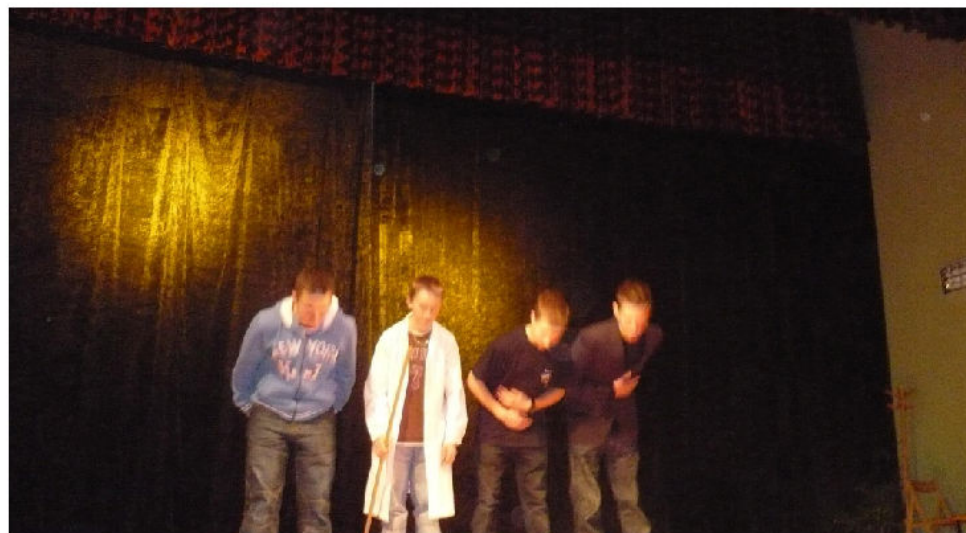
Kabaret Bober w pełnej odświeżeniu.

Zapewne zastanawia was skąd się wziął taki tytuł. Jeżeli przeczytacie nasz artykuł, to będziecie wiedzieli o jakie tak naprawdę bobry chodzi.