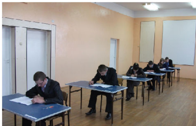
Egzamin Gimnazjalny 2010.

Aby mózg pracował na pełnych obrotach potrzebuje odpowiedniej ilości paliwa. Horyzonty myślowe poszerzą tylko dobrze dobrane produkty żywnościowe. Aby poprawić pamięć, złagodzić stres, trzeba mądrze jeść, nie tucząc się przy okazji. Śniadanie to podstawa , a urozmaicona dieta