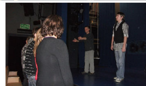
Grupa teatralna z Rosochatego i GOK - u w Czyżewie podczas warsztatów teatralnych w Łomży realizowanych w ramach projektu "Nieżyły Teatr".