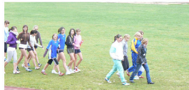
Kondycja dziewcząt w roku szkolnym 2009/2010 nie słabnie. Dziewczęta nadal są w dobrej kondycji, zdobywając kolejne szczeble w sporcie.

Dnia 22.04.2010 roku nasze dziewczęta pojechały do Klukowa na Powiatowy Turniej Piłki Nożnej Coca Cola Cup. Tam nasze sportswomenki zajęły III miejsce . Sprawilo im to ogromną radość, a ich trenerka była z nich