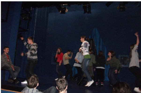
"Niezły Teatr" w akcji - zajęcia warsztatowe w teatrze w Łomży.