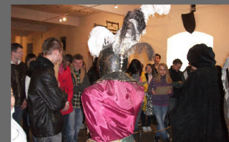
Słuchanie wykładu Bakałarza.