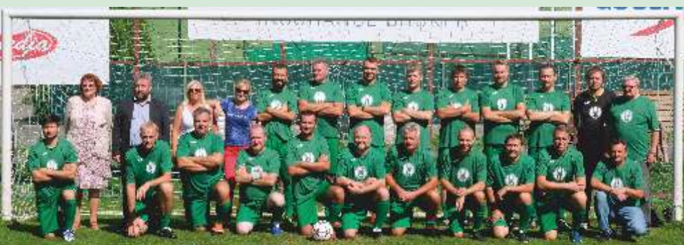
Družstvo Slovenskej poľnohospodárskej univerzity z Nítry