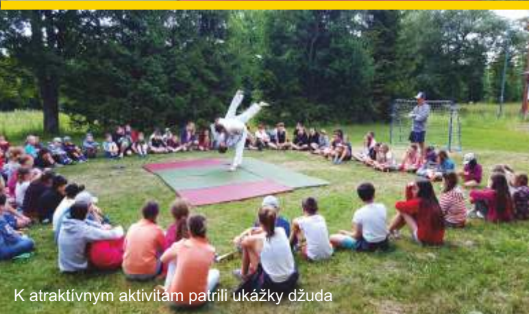
K atraktívnym aktivitám patrili ukážky džuda