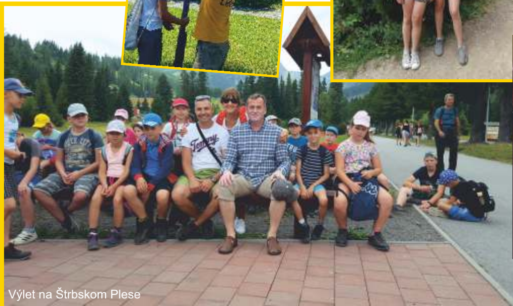
Výlet na Štrbskom Plese