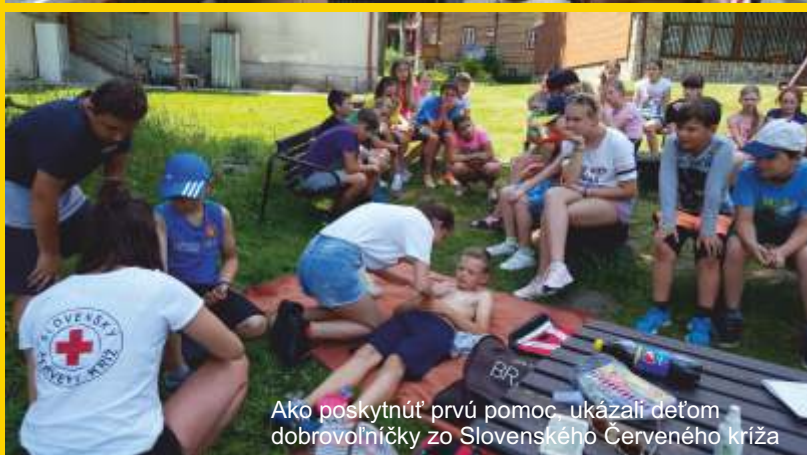
Ako poskytnúť prvú pomoc, ukázali deťom dobrovoľníčky zo Slovenského Červeného kríža