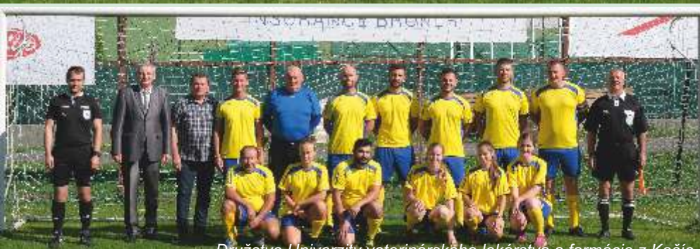
Družstvo Univerzity veterinárskeho lekárstva a farmácie z Košíc