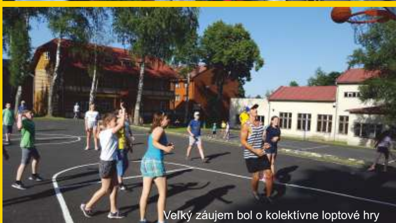
Veľký záujem bol o kolektívne loptové hry