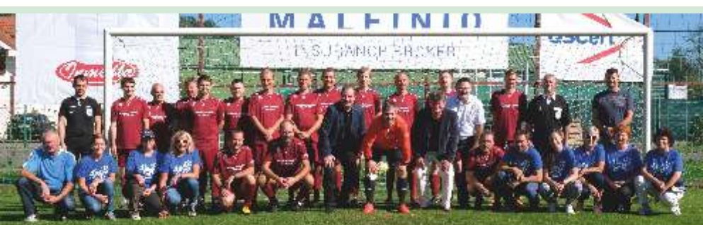
Víťazné družstvo Technickej univerzity vo Zvolene