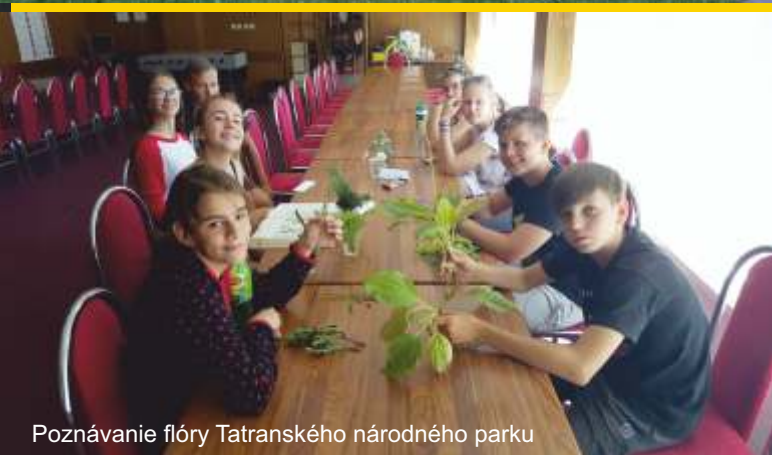
Poznávanie flóry Tatranského národného parku